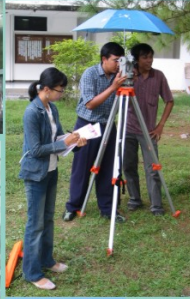
Kegiatan pemetaan lahan