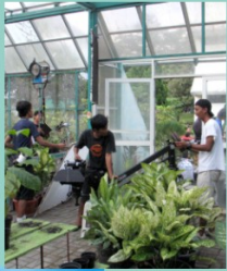
Proses produksi materi komunikasi pertanian di rumah kaca.