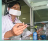
Teknologi Kultu Jaringan